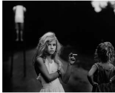
Abb./fig. 6 Sally Mann Candy Cigarette Gelatine Silver Print 1989

In dem Bildpaar „Nicolas 2009/2010“, das den Sohn von Iris Janke in Rückenansicht auf einem Stuhl sitzend zeigt, vermischen sich die beiden beschriebenen Ebenen: das Wiederaufgreifen eines Motifs in zeitlichem Abstand und eine scheinbare Bewegungssequenz. Dem flüchtigen Blick mag es erscheinen, als seien die zwei Bilder unmittelbar hintereinander aufgenommen worden. Eben sitzt der kleine Junge noch auf dem Stuhl, um kurz darauf aufzustehen. Doch beim genaueren Hinsehen entdeckt man, dass der Stuhl ein anderer ist, auch die Hose ist nicht mehr dieselbe. Details weisen den Betrachter darauf hin, dass das Foto zu einem späteren Zeitpunkt gemacht wurde. Inszenierung hat auch bei dieser Bilderfolge sicher eine Rolle gespielt, wodurch sie aus der Dokumentation eines Augenblicks heraustritt und eine zweite Ebene erhält. Die Fotos scheinen nicht nur einen Bewegungsablauf festzuhalten, sie beschreiben auch eine metaphorische Bewegung weg vom Betrachter, weg von der Fotografin – eine Geste der Selbstständigkeit, ein kleiner Schritt ins Leben.