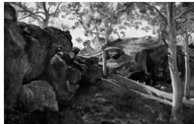
Abb./fig. 1 Camille Corot Das Kastanienwäldchen/ The Chestnut Grove Öl auf Leinwand/Oil on canvas . ca. 1830–40

Erzählerische Kraft entwickeln die Fotografien in der Reihung, in der Bilder unterschiedlicher Formate und unterschiedlichen Inhalts zusammengestellt werden. Dazwischen stehen weiße Seiten, die die Narration unterbrechen. Durch die