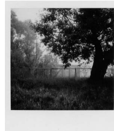
Abb./fig. 11 Andrej Tarkovskij Mjasnoje, 26. September 1981/ September 26, 1981 Polaroid 1981

“And several of these wonderful portraits [...] have I seen lately, longing to have such a memorial of every being dear to me in the world. It is not merely the likeness which is precious in such cases – but the association and sense of nearness involved in the thing ... the fact of the very shadow of the person lying there fixed for ever!” (Elizabeth Barrett) 14