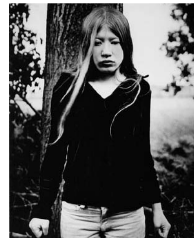
Abb./fig. 7 Ingar Krauss Hannah, Zechin 2005 Gelatine Silver Print 2005

The pair of photos that show Nicolas in rear view sitting on a chair bring together the two levels – the return to a motif after an interval of time, and the apparent sequence of movements. At first glance, it appears as though the two pictures were taken one immediately after the other. The small boy was sitting on the chair only a moment ago, only to stand up again shortly thereafter. Yet upon closer examination we discover that the chair is not the same chair; the pants, too, are no longer the same pants. Details suggest that one photograph was taken at a later point in time. It becomes clear to the viewer that there is an element of staging at work in this series, making it more than a simple documentation of events in a given moment, and infusing it with a second layer of meaning. The photographs seem not only to capture a series of movements but to describe a metaphorical movement away from the viewer, away from the photographer – a gesture of self-sufficiency, a small step into life.