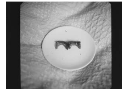
Abb./fig. 10 Iris Janke Brücke/Bridge a.d.S./from the series On the Lakeshore ... and other Stories Polaroid 2009/2010

is a unique original, but also that the image acquires a special character as an object. This effect is made more powerful still in the presence of handwritten notes, as we find in Janke's work. In the age of digital photography, Polaroids almost seem like relics from the distant past. The idiosyncratic aesthetic effects produced by the process – a slight blurring, grainy resolution, and bleached-out colors – underscore their nostalgic character. The straightforward technical process and the immediacy of the image – a quality Roland Barthes described as the “emanation of a past reality: a magic” 13 –