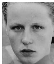
Abb./fig. 4 Roni Horn a.d.S./from the series You are the weather 36 Gelatine Silver Prints und/and 64 C-Prints 1994–1995