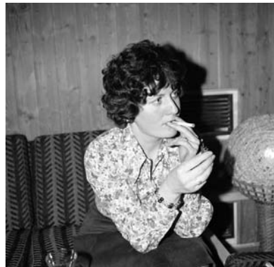
Abb./fig. 2 Iris Janke Studie 1/1 a.d.S./from the series On the Lakeshore ... and other Stories 1 C-Print und/and 1 Gelatine Silver Print 1975/2010

Vereinzelt gliedert Iris Janke auch Bilder aus den Familienalben ihrer Eltern in diese Bildcluster ein. In das Tableau über ihre Kinder integriert sie zwei Fotografien von sich selbst als kleines Mädchen, die sich fast nahtlos in das Bildfeld einfügen. Die Gegenüberstellung von Motiven und Stimmungen, die sich innerhalb unterschiedlicher Generationen wiederholen, unterstreicht den nostalgischen Charakter der Bilder. Die gefundenen Fotografien ergänzen die eigenen und erweitern das Dargestellte um eine weitere Zeitebene. Die eigene Vergangenheit setzt Iris Janke so ins Verhältnis zur Wahrnehmung der Gegenwart. Bilder aus dem fotografischen Archiv ihrer Mutter (die selbst Fotografin