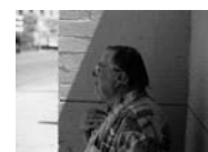
Abb./fig. 5 Paul Graham Las Vegas (Mann an der Bushaltestelle/ Man waiting for bus) a.d.S./from the series Shimmer of Possibility 6 C-Prints 2005

In a few places, Iris Janke intervenes to create deliberate comparisons. When she took the picture of her son sitting with a friend in front of a house (fig. 3), perhaps she just wanted to capture that scene. But when she took the picture of him sitting with a different friend in the same place and almost the same position one year later, it seems likely that she positioned them that way. This staging does intensify the impact that two similar pictures have on the viewer: it directs the viewer’s attention less toward the similarities than toward the